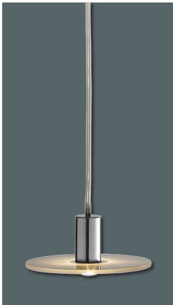
THEIS® Lacerta pendel Hvidt opalt glas med krom pendeltop