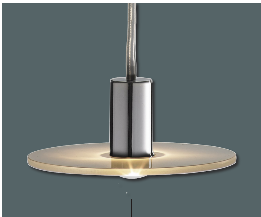
THEIS® Lacerta pendel Hvidt opalt glas med krom pendeltop